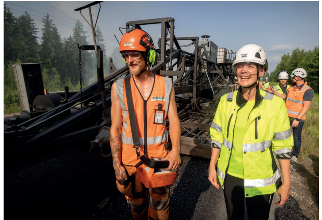
Lulu Ranne tunnetaan utterana ja aikaansaavana ministerinä.

– Liikenteessäkin keskitytään nyt perusasioihin. Kun rahaa on niukasti, on paukut pistettävä ensisijaisesti nykyisistä tie- ja raideyhteyksistä huolehtimiseen. 12-vuotisen suunnitelman esitys sisältää mm. linjauksia, joilla huonokuntoisten teiden ja raiteiden kilometrimäärien kasvu saadaan taitettua ja vuosien ajaksi kasvu myös käytännössä pysähtyisi. Korjausvelan kanssa tekee siis tiukkaa, mutta kun talous läh-